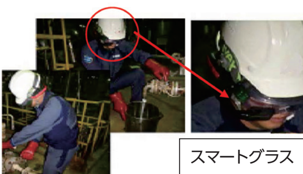
スマートグラスの活用状況 （三菱ケミカル㈱）