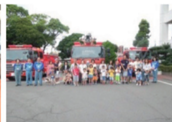
合同訓練や家族見学会の様子（コスモ石油㈱）