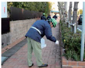
工場周辺の清掃活動 (昭和四日市石油株)

このような地域一体となった清掃活動を通じて、地域住民と顔の見える関係を構築しています。