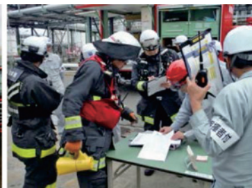
消防本部との連携訓練 (株)ENEOS マテリアル・JSR(株)