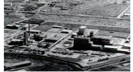
②1969(昭和44)年頃の味の素(株)東海事業所