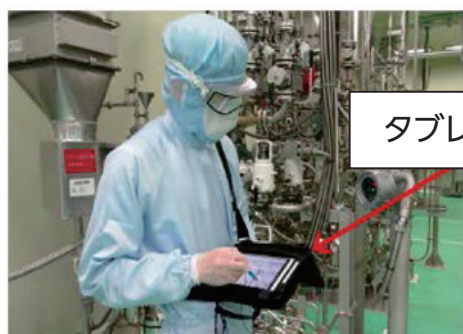
タブレットの使用状況 （JSR㈱）