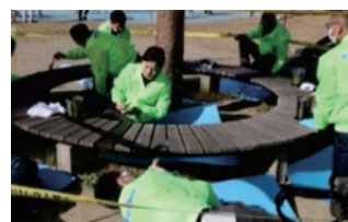
霞ヶ浦緑地公園の ベンチ塗装 (KHネオケム株)

KHネオケム(株)四日市工場では、コンビナートに隣接する霞ヶ浦緑地公園の木製ベンチ等の塗装や新しくベンチを設置するなどして、公園を利用する市民の憩いの場を提供する活動を実施しています。