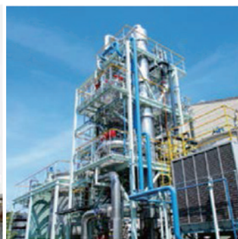
排水中のアンモニア低減を目的と したアンモニアストリッピング設備 （石原産業株式会社）