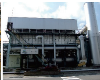
蓄熱燃焼式排ガス処理施設 （株式会社ENEOS マテリアル）