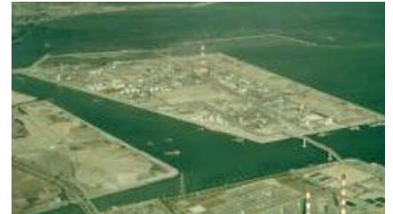
③操業当初の新大協和石油化学(株)(現 東ソー)