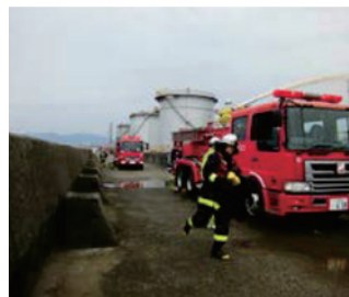
自衛消防隊との連携訓練 (コスモ石油株)