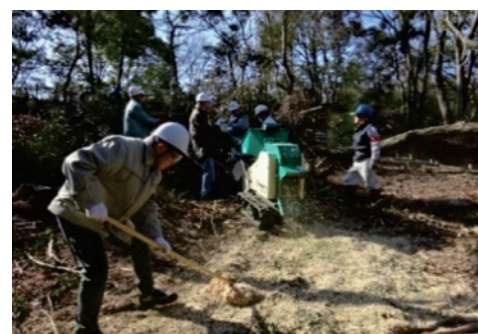
平成24年からKIEP'Sが実施している 里山保全活動（南部丘陵公園の常緑樹間伐）

定期的に里山の手入れを行うことにより、樹木の成長を促す日光が適時差し込み、森林を豊かにして生態系の維持に貢献しています。