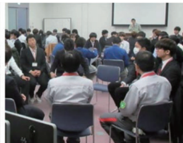
大学生を対象とした企業説明と工場見学（KHネオケム㈱他）