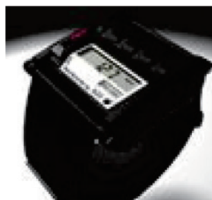
バイタルセンサー (味の素株)

バイタルセンサーは、働く従業員の体温・心拍・加速度(転倒)・位置情報などをリアルタイムでモニタリングすることができ、働く従業員の「安全と安心」に繋がっています。