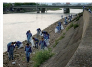
河川の清掃活動 (コスモ石油株)