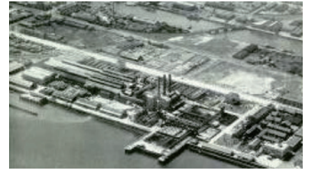
①昭和20年代の日本板硝子(株)四日市工場