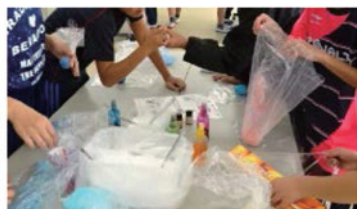
体験教室の様子（東ソー㈱）