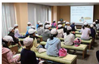
社会見学の様子（昭和四日市石油㈱）