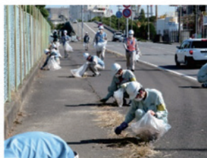
工場周辺の清掃活動 (三菱ガス化学株)