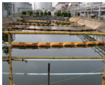
排水を処理する装置 （コスモ石油株式会社）