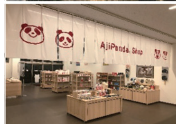
体験型の工場見学が可能（味の素㈱）