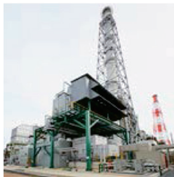
CO 2 排出を削減している ガスタービン（東ソー株式会社）